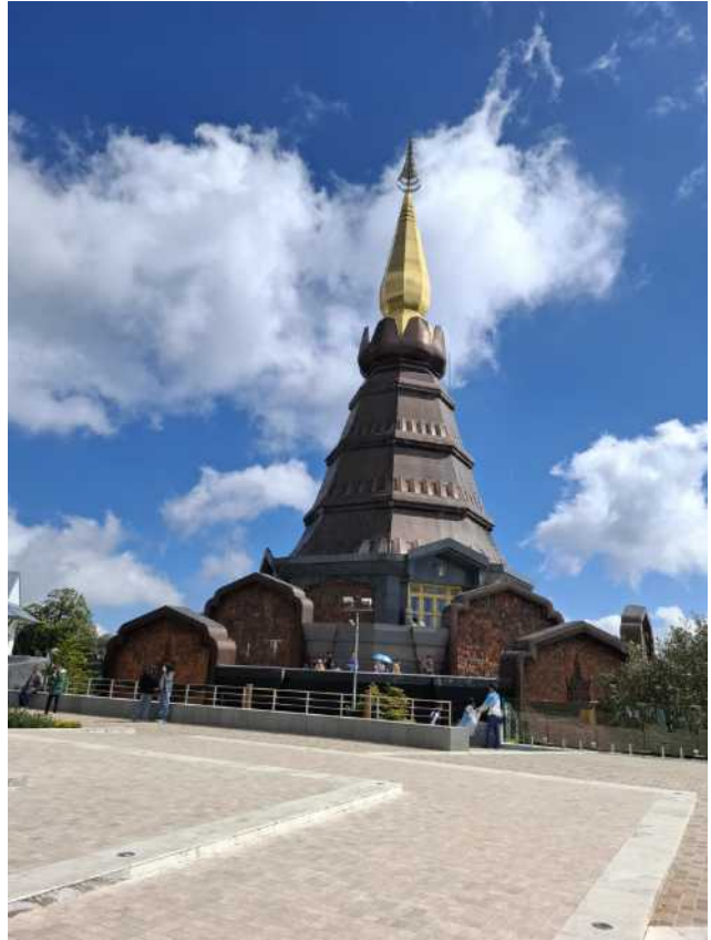
Doi Inthanon 2565 Meter höchster Berg in Thailand, wird im Winter auch bis -5 Grad.