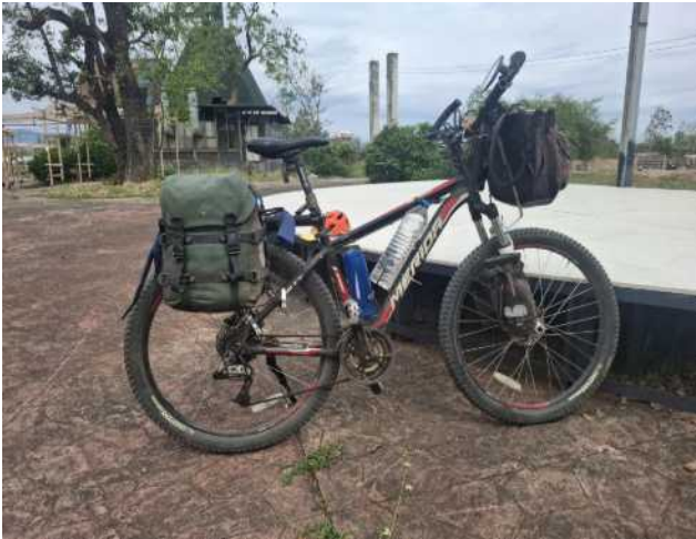
Mein Bike in Thailand