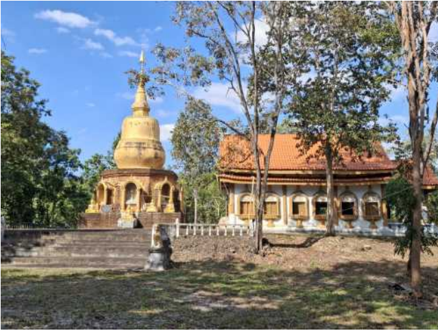
Im Tempel Geschlafen