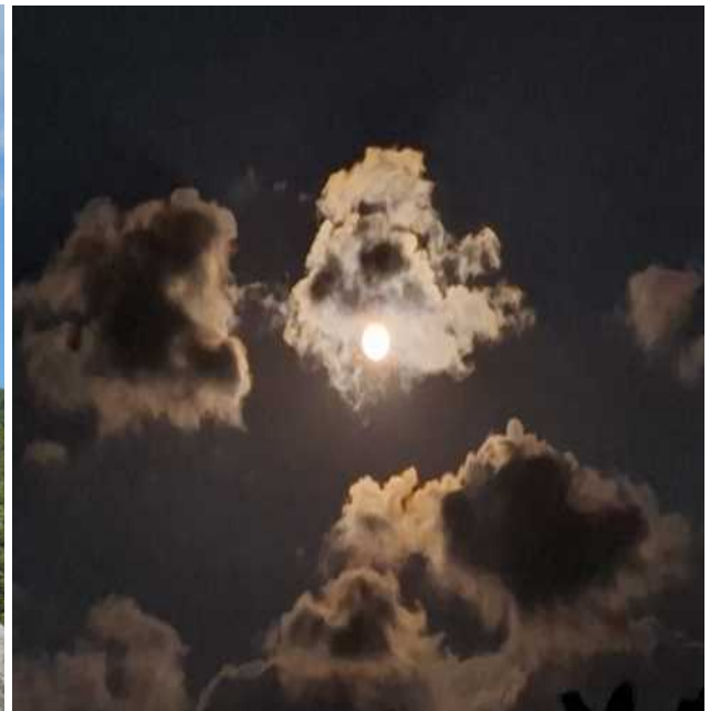
Erster Vollmond im 2026