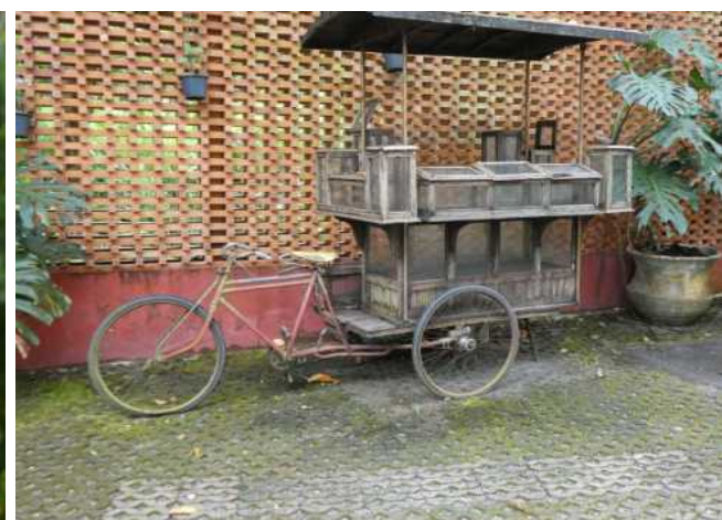
Alter Rikscha Verkaufsstand