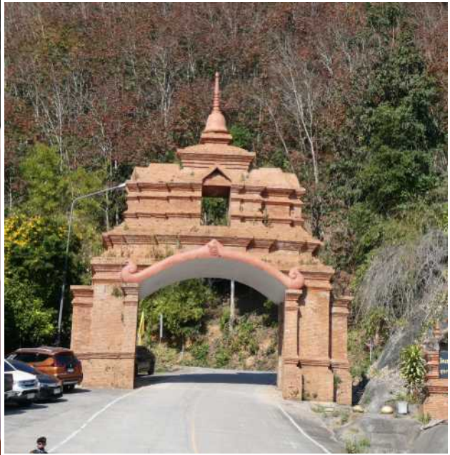
Einfahrt zu einem Tempel auf den Berg