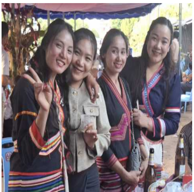
Hauseinweihung mit ca. 300 – 400 Gästen