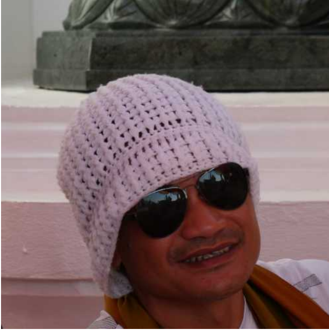
Es ist nur ca. 27 Grad

06.Jan. Mit dem Bike ging es wieder weiter in den Norden.