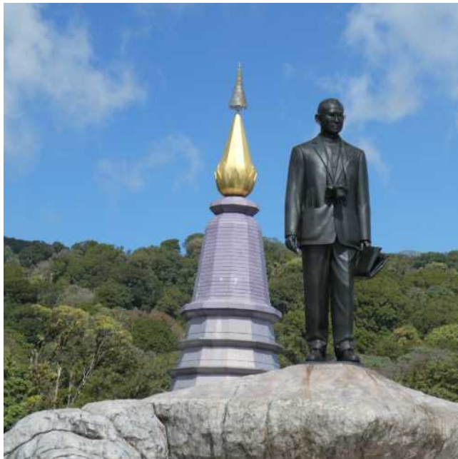
König Bhumibol Adulyadej von Thailand war 70 Jahre im Amt