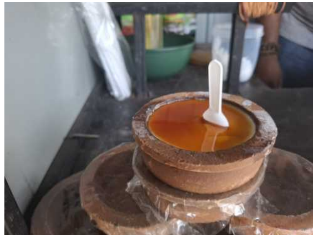
Hatte teils sehr gute Sachen