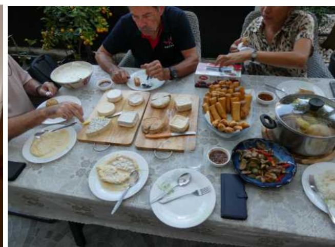
Meine selbst gerollten Frühlingsrollen: das ist gar nicht so einfach